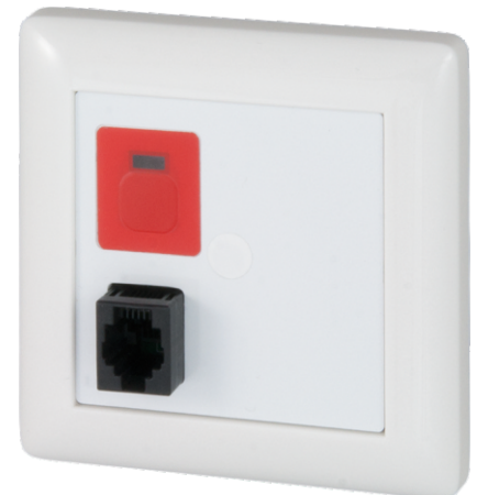
RTN-IP mit Rahmen und Zentralstück