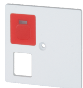
Zentralstück für RTN-IP